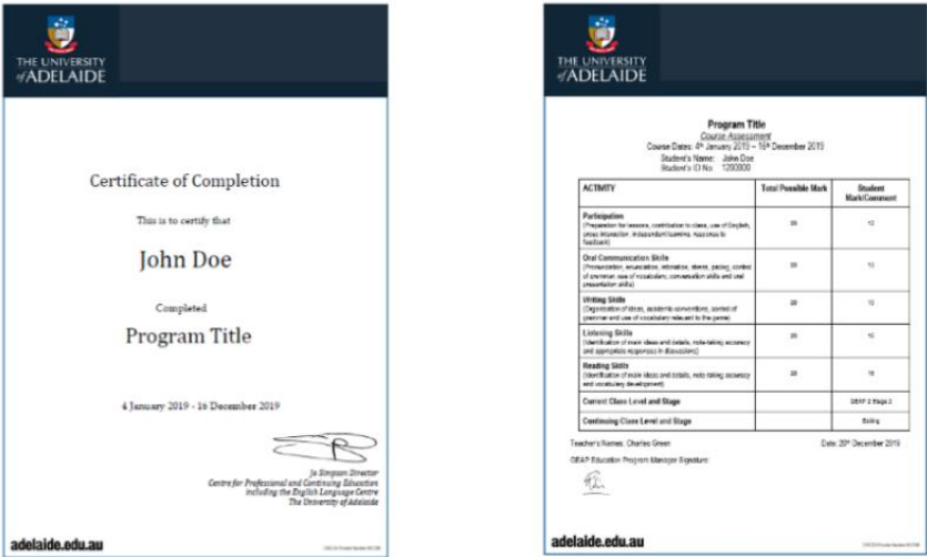
图：阿德莱德大学项目证书与成绩单样图

顺利完成所有课程，并通过学术考核的学生，将获得阿德莱德大学出具的正式成绩单及学习证明。